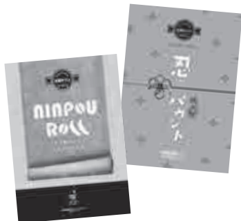
▲商品化されたロールケーキの「NINPOU ROLL」とパウンドケーキの「忍パウンド」

そして、3月25日には、市内商業施設で完成した商品の販売会が行われ、最優秀賞を受賞したチームの生徒たちが直接販売を行いました。