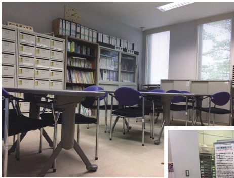
◀情報交流スペースとメールボックス