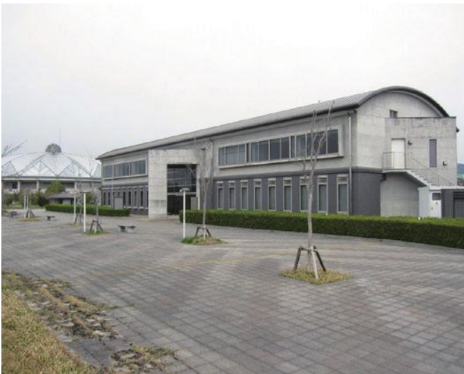
支援センターが設置されているゆめぼりすセンター