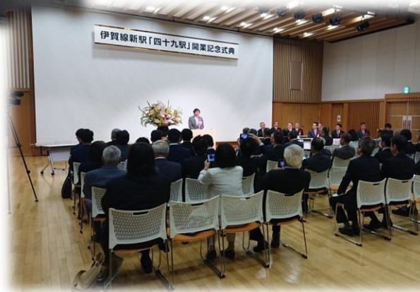
新駅「四十九駅」開業記念式典