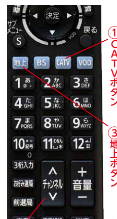
②④チャンネルボタン