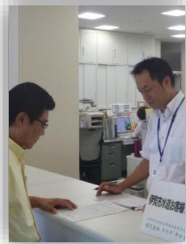
水道お客さまセンター窓口

【基本方針】 経営基盤の強化 【実現方策】 民間的経営手法の活用検討 水道料金関連業務委託 【実施成果】 職員の資質向上に努め、業務内容について適切な指導を行い、委託業務が適正に履行されているかの進捗管理を行うことで、顧客サービスの向上と業務の効率化に努めました。