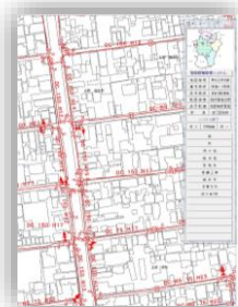
管路情報管理システム