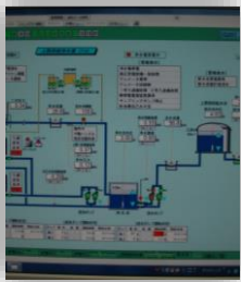
遠隔監視システム

【基本方針】 経営基盤の強化 【実現方策】 適切な施設管理 伊賀市遠隔監視システム整備 【実施成果】 上水道、簡易水道統合により複雑化した複数の遠隔監視システムを統合し、円滑に維持管理がおこなえるよう整備しました。