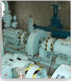
上野南送水ポンプ所 送水ポンプ

【基本方針】 資源・エネルギーの有効利用 【実現方策】 省エネルギーの効率的機器の採用 上野南送水ポンプ所送水ポンプ更新 【実施成果】 設置後10年が経過したポンプ設備を更新し、安定した送水ができるようになりました。