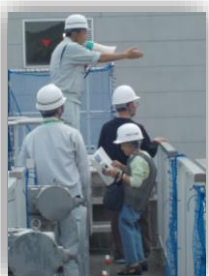
施設見学会の様子

【基本方針】 お客さまサービスの向上 【実現方策】 啓発活動の推進 ゆめが丘浄水場見学会 【実施成果】 新型コロナウイルス感染症予防の観点から、令和2年度の開催は中止しました。