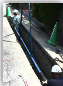
管路の耐震化更新工事