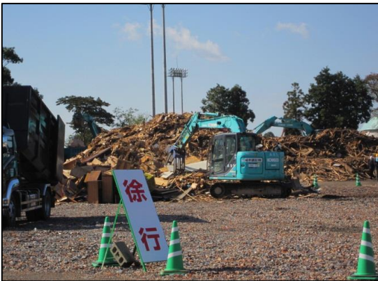
【熊本地震での二次仮置場の状況】