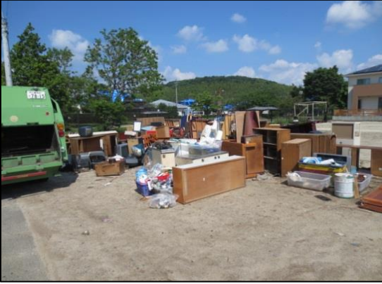
【熊本地震での一次仮置場の状況】