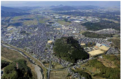
▲水口岡山城と城下町

水口岡山城は、天正13（1585）年に豊臣政権の拠点城郭として築かれました。 このフォーラムでは、大学教授や各市の文化財担当者を迎え、織豊期から近世初頭の城と城下町をテーマに、伊賀市、亀山市、甲賀市の城と城下町との比較を通して、それぞれの魅力に迫ります。