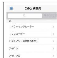
ごみ分別辞典画面