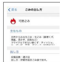
ごみの出し方画面