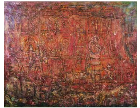
市展「いが」賞(絵画部門) 『縄文の調べ』 西 良三 (腰山)