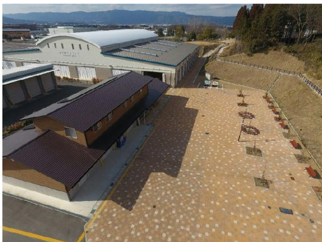
しらさぎ運動公園整備直後のドローン撮影写真