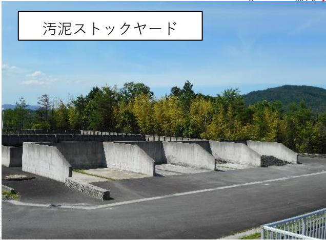
汚泥ストックヤード