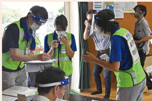
受付でチェックを受ける避難者役の職員

健康チェックリストに従って避難者に聞き取りを行い、発熱や咳などの症状がある場合、ほかの避難者と接触しないよう別室へ案内するなど、新型コロナウイルスの感染を予防しつつ避難者を受け入れる方法を学びました。