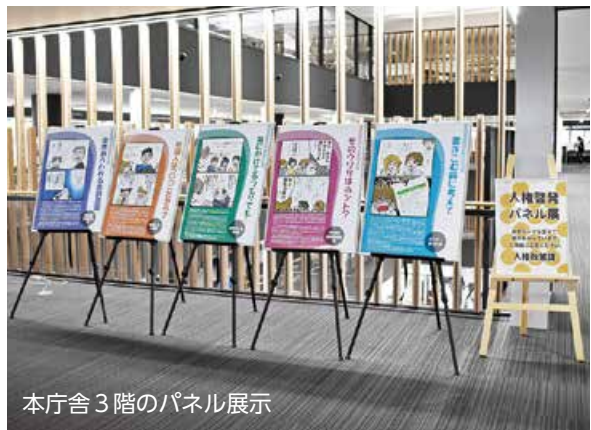
本庁舎3階のパネル展示