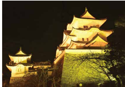
感染拡大防止強化期間中、黄色にライトアップされた上野城

今後も自分や周囲の人の健康を守るため、感染対策を十分に行い、感染リスクの高まる「5つの場面」に注意しましょう。