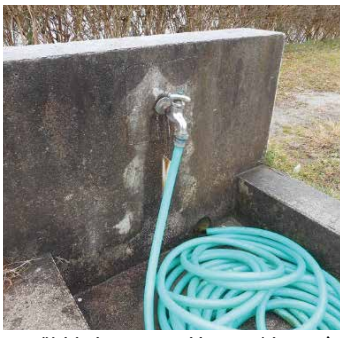
▲敷地内には、共用の蛇口が配備されているので、水やりも簡単です。