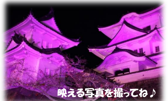
映える写真を撮ってね♪