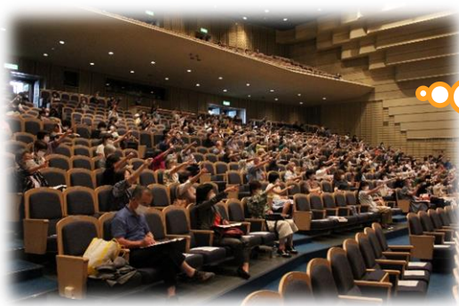
📍 客席は密を避けるため、間をあけて