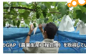
伊賀白鳳高等学校