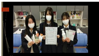
あけぼの学園高等学校