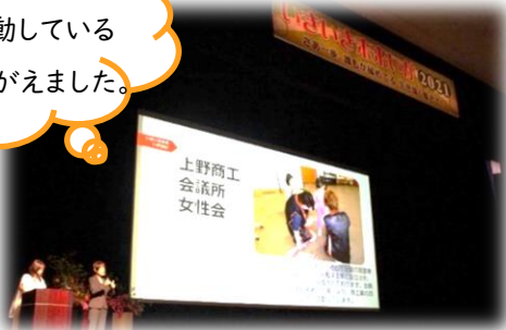
📍 オープニングステージで、男女共同参画 ネットワーク会議会員紹介

新型コロナの影響で、去年は実施を断念しましたが、満を持して今年の開催が実現しました!! 感染防止対策を万全にするために、会場を大規模な伊賀市文化会館に変え、接触を避けるために例年実施していた「いきいき交流広場」を中止するなど、実行委員会で検討を重ねて、形作りました。