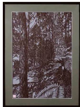
【彫塑工芸部門】 「熊野古道」 川村 正行