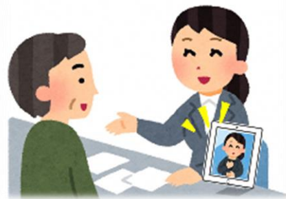
公的機関での 手続き