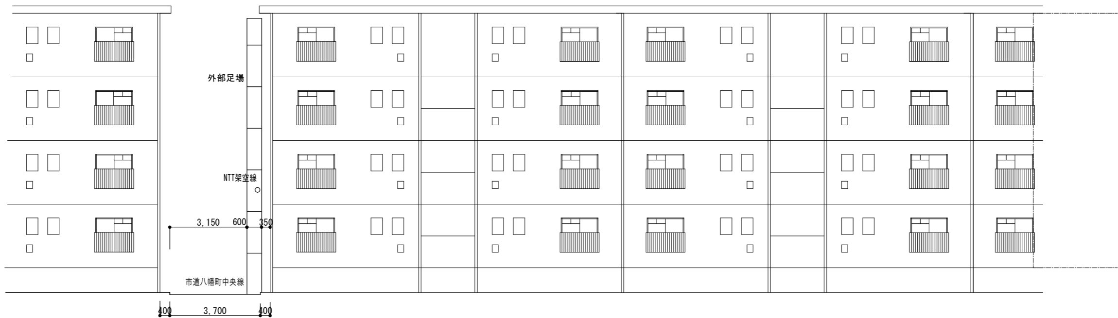
北立面図（西之平団地） S : 1/150