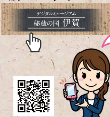
▼市ホームページバナー

スマートフォンで2次元コードを読み取るか、市ホームページにあるバナーをクリックしてください。