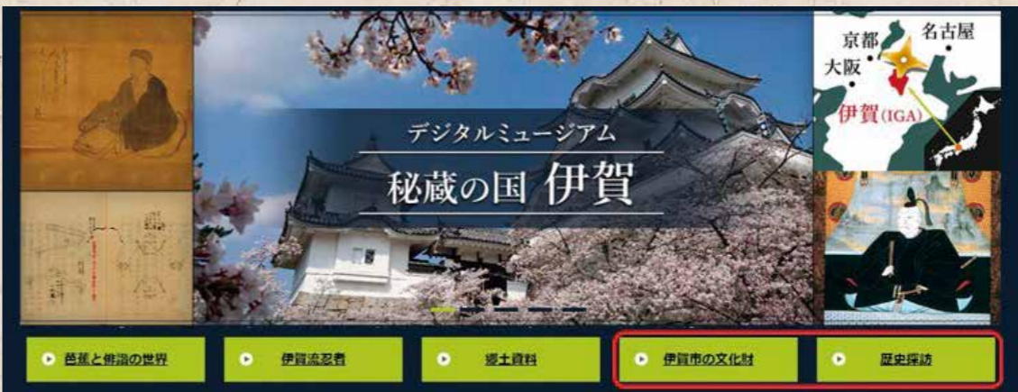
▲トップページ(一部抜粋)

「デジタルミュージアム 秘蔵の国伊賀」は、伊賀市の貴重資料をデジタルデータで記録・保存し、公開するデジタルアーカイブ事業です。この度、新たに「伊賀市の文化財」「歴史探訪」を追加し、予定していたすべてのテーマを公開しました。