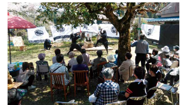
毎年4月初旬の「花まつり」の様子