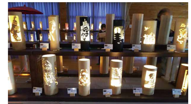
「竹工房教室」受講生の作品展を開催

【ところ】 山添村大字広瀬 225-1 ☎ 0743-85-1071 【営業日】 毎週水・土・日曜日 午前10時～午後3時