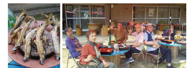
自然にふれあいながら、鮎料理を堪能するグループ ※写真撮影時のみマスクを外しています。