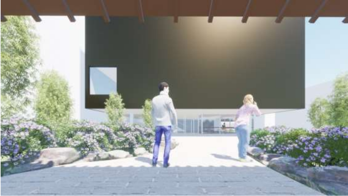
【4. 忍者体験施設内観イメージ①】