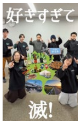
若者会議募集PR動画