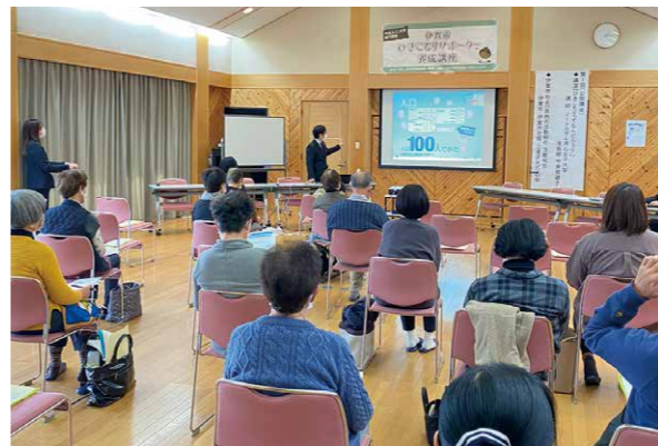
ひきこもりサポーター養成講座の様子(令和3年度)

市では地域福祉計画に基づき、「ひきこもりサポート事業」を伊賀市社会福祉協議会に委託し、ひきこもりに関する本人・家族への相談支援、フリースペース「nest」の開設、相談機関のネットワークづくりなど生きづらさをかかえた人に寄り添う