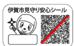
タテ 2.5cm ×ヨコ 4cm