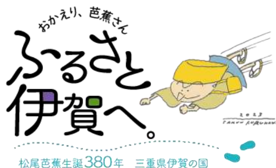
▲芭蕉翁生誕 380 年記念事業ロゴマーク

記念事業に賛同する団体・個人などの実施主体が取り組む事業で、芭蕉翁生誕 380 年記念事業実行委員会の審査により、上限 50 万円の補助金を活用いただけます。