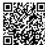
講座一覧 (二次元コード読み取り)