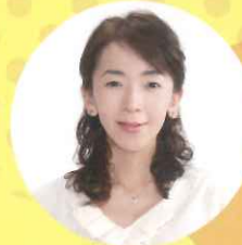
フリーアナウンサー 向 ますみ