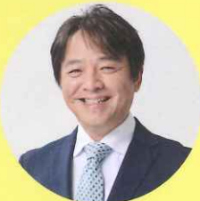
NHK津放送局 藤崎 弘士 アナウンサー