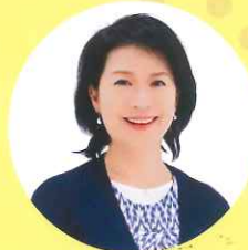
フリーアナウンサー 中川 京子