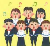
コーラス 上野合唱団