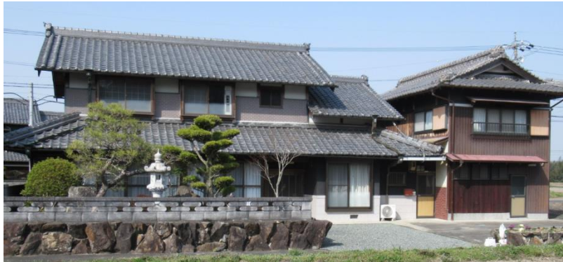
（購入された空き家バンク物件）

平成 28 年より運営している「伊賀流空き家バンク」について、利用者が延べ登録者数 1800 人以上、物件成約数 215 件と大変好評をいただいておりますが、この度、バーチャル内覧を通じて初めて沖縄県（石垣島）のご家族が物件を購入され、伊賀市に移住することが決まりましたのでお知らせします。