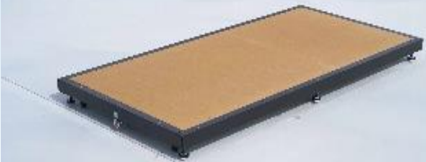
③マニュアルパッド