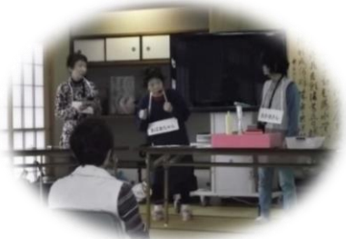
昨年度の講座の様子