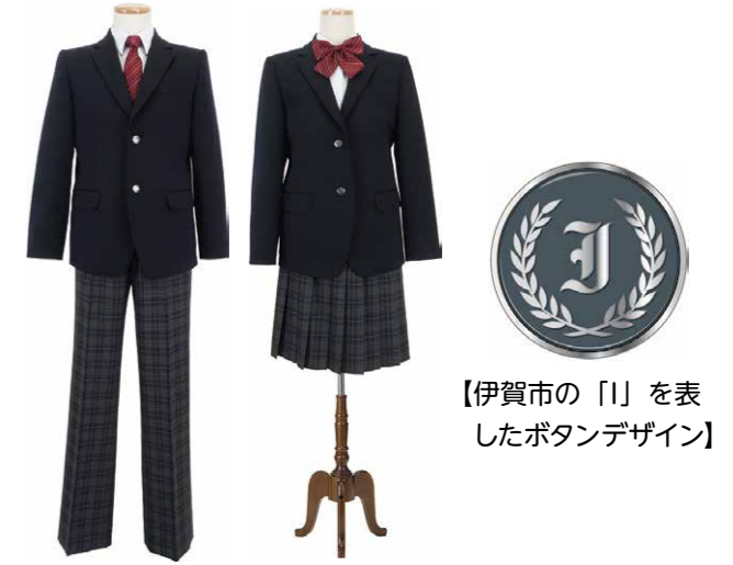
【伊賀市の「I」を表したボタンデザイン】