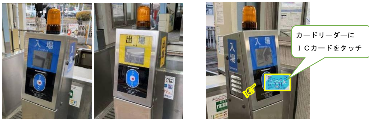
IC改札機(青:入場用、黄:出場用)