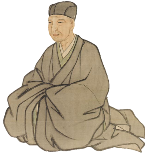
来章画奇淵賛「蓬萊に」等芭蕉四句画賛（伊賀市蔵）