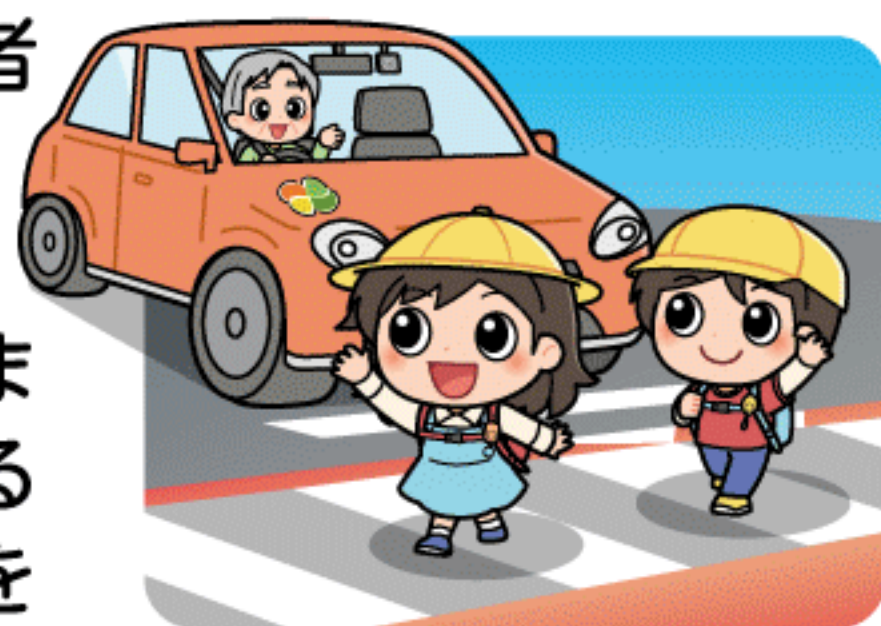
横断歩道は歩行者優先

横断歩道は歩行者優先です。運転者には横断歩道手前での減速義務や停止義務があります。歩行者の横断を妨げないようにしましょう。歩行者や他の車両に対する「思いやり・ゆずり合い」の気持ちを持って運転しましょう。