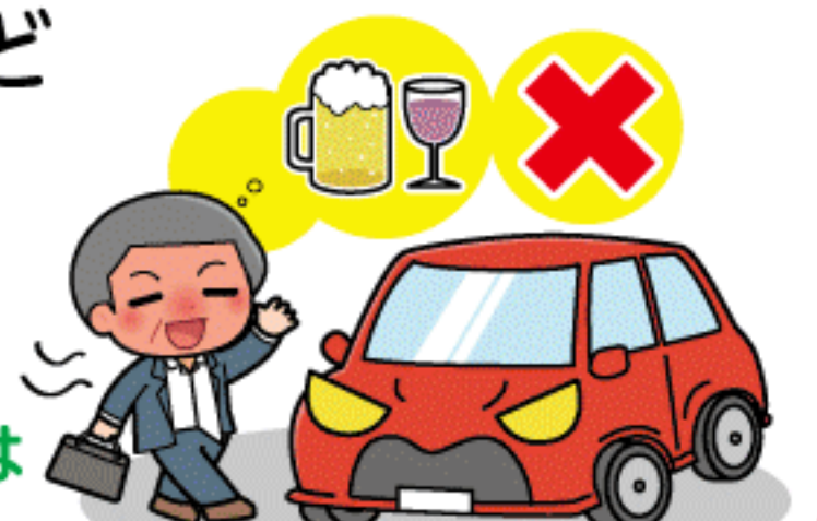
飲酒運転は絶対ダメ!

飲酒運転やあおり運転(妨害運転)は極めて悪質で危険な犯罪です。アルコールは少量の摂取でも安全運転に必要な情報処理能力、注意力、判断力などを低下させ、交通事故の危険を高めます。お酒を飲んだら絶対に車を運転してはいけません。あおり運転もやめましょう。