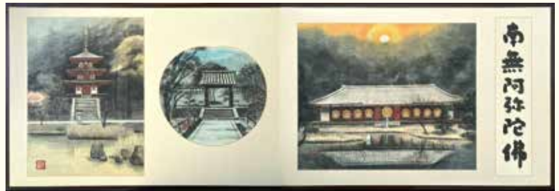
浄瑠璃寺屏風 (穂月明作)