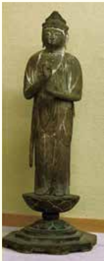
菩薩立像／千体仏と伝わる (穂月明旧蔵・伊賀市蔵)

開館 10時～16時30分（入館16時まで） 料金 一般300円（高校生以下無料） 会場 伊賀市ミュージアム青山讃頌舎 伊賀市別府718番地3