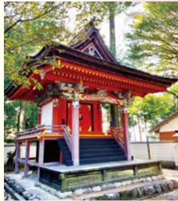
重文・大村神社宝殿