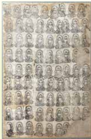
浄瑠璃寺九体阿弥陀納入 阿弥陀如 来坐像摺仏 (穂月明旧蔵)