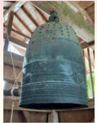
新指定 伊賀市文化財 大村神社虫喰鐘