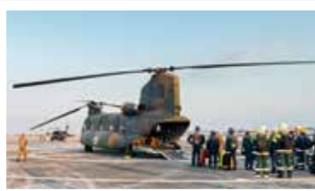
ヘリで輸送艦に移動

大地震などの大規模災害時に、航空機が離着陸できる施設に臨時の医療施設を立ち上げ、重篤患者等を被災地域外へ運び出すための航空搬送拠点。