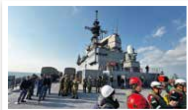
輸送艦しもきた(甲板、艦橋)