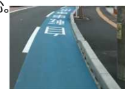
＜自転車の走行性に配慮した排水構造の例＞