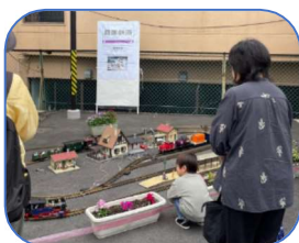
庭園鉄道に興味津々