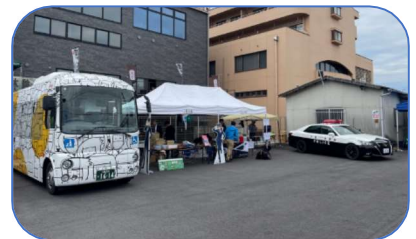
にんまる・パトカーも集結