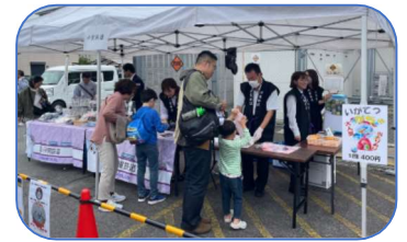
伊賀鉄道等のグッズ販売