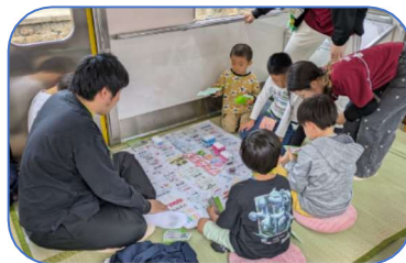
和歌山大学の人生ゲーム