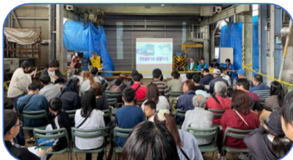
鉄道クイズにみんなで挑戦