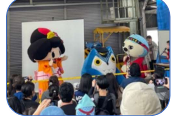
ゆるキャラ®も来て大賑わい