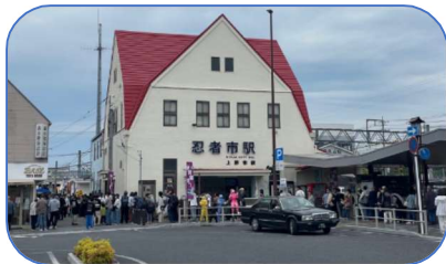
開場前は駅前まで長蛇の列