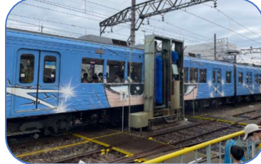
洗車体験は大盛況