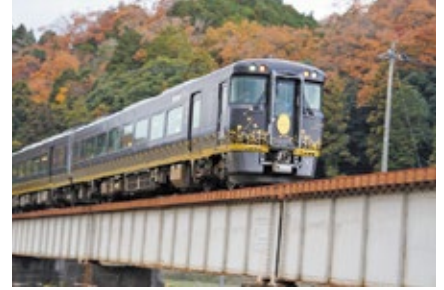
「観光列車はなあかり」