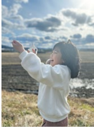
「 たこ 凧あげ」