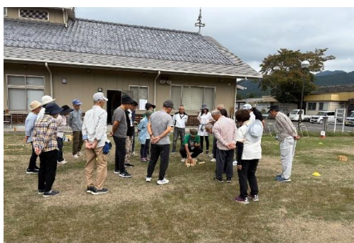
阿波地区で開催された、モルック体験会の様子です。