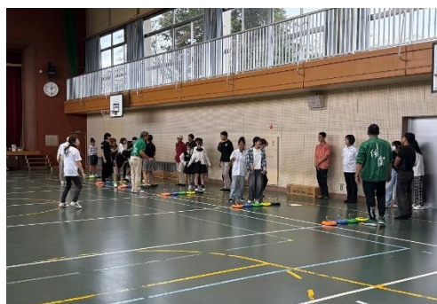
猪田多文化交流の会主催、カロリング大会の様子です。