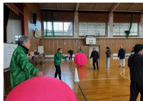
壬生野地区で開催された、キンボール大会に会長・副会長が参加しました