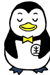
夏生ペンギンのホゴちゃん