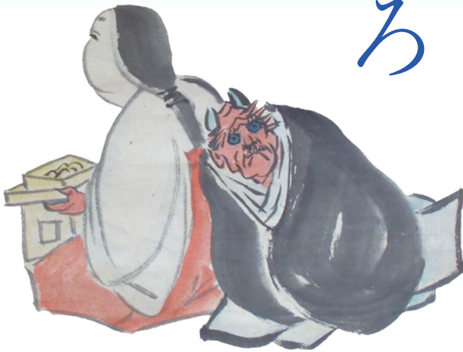
斗麦筆「つかの間の」発句自画賛(伊賀市蔵)