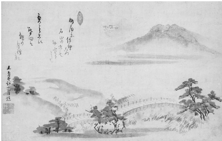
許六筆「ほととぎす」発句自画賛（芭蕉翁顕彰会蔵）