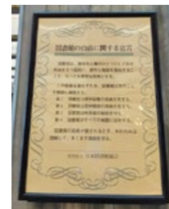
▲伊賀市中央図書館に掲げている宣言文