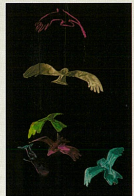
モバイル活動イメージ